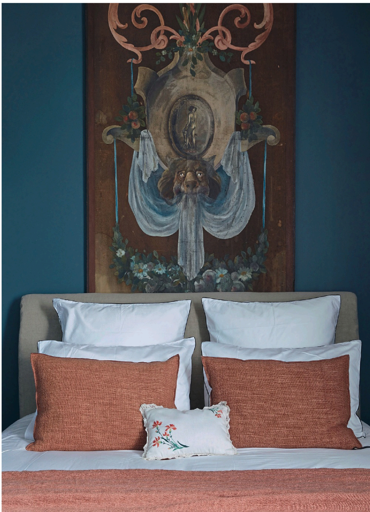
À GAUCHE Mise en scène. En prolongement de la tête de lit, un décor de théâtre chiné. Linge sur mesure, Le Bel Instant. Dessus-de-lit et coussins, Maison de Vacances. Coussin brodé réalisé par d.mesure. À DROITE Une baignoire à l'ancienne, Ma Salle de Bain Rétro. Robinetterie, Margot. Aux murs, des carreaux de terre cuite, Cotto Etrusco, et un bronze chiné. Produits de beauté, Biosalines, fabriqués sur l'île de Ré. Échelle chinée.