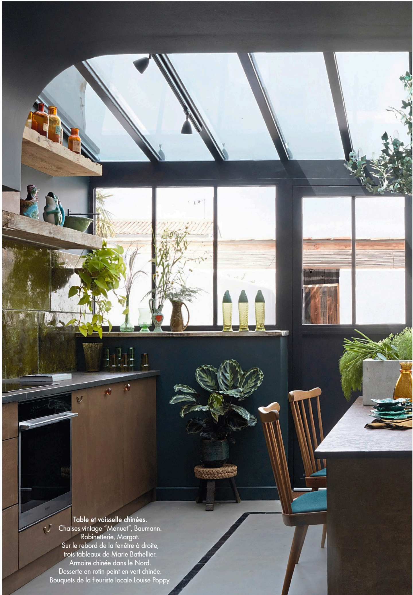
Table et vaisselle chinées.